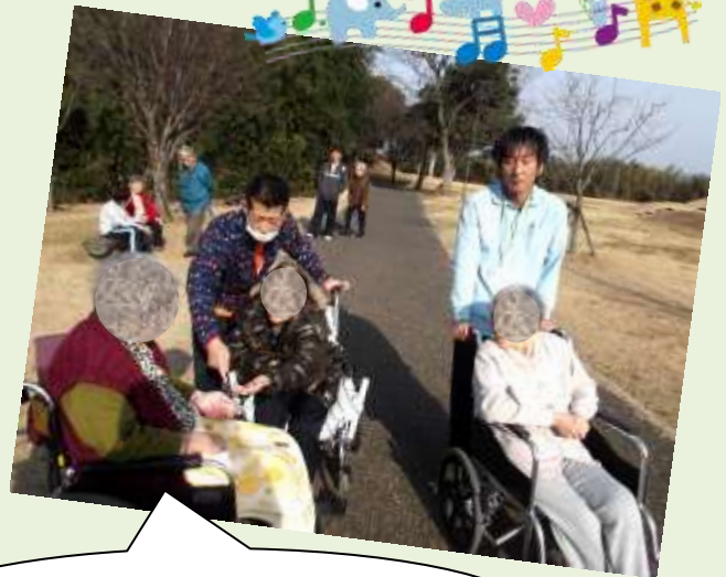
古墳周辺をゆっくりと散歩 古墳の上まで上った方もいました。