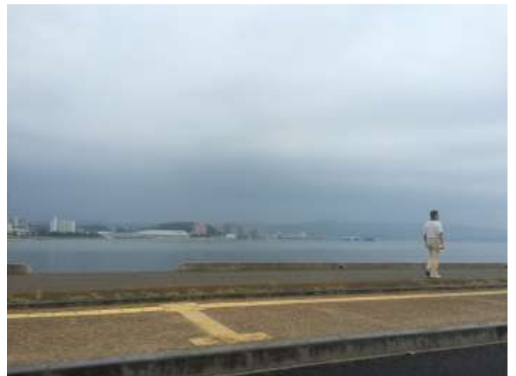
↑でっかい宍道湖(しんじこ) しじみが有名です