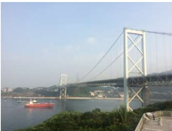
↑まずは関門大橋で、九州脱出！！