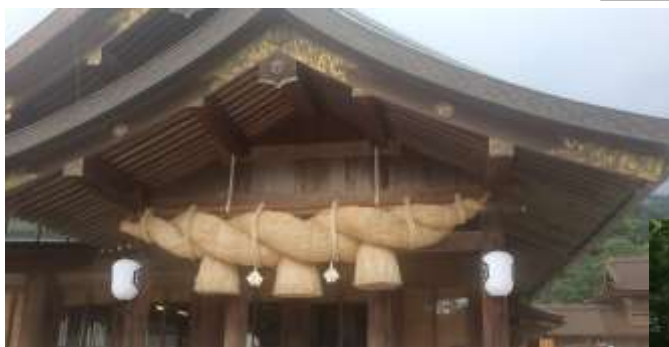
↑出雲大社の大しめ縄 いなばの白兔の石碑→